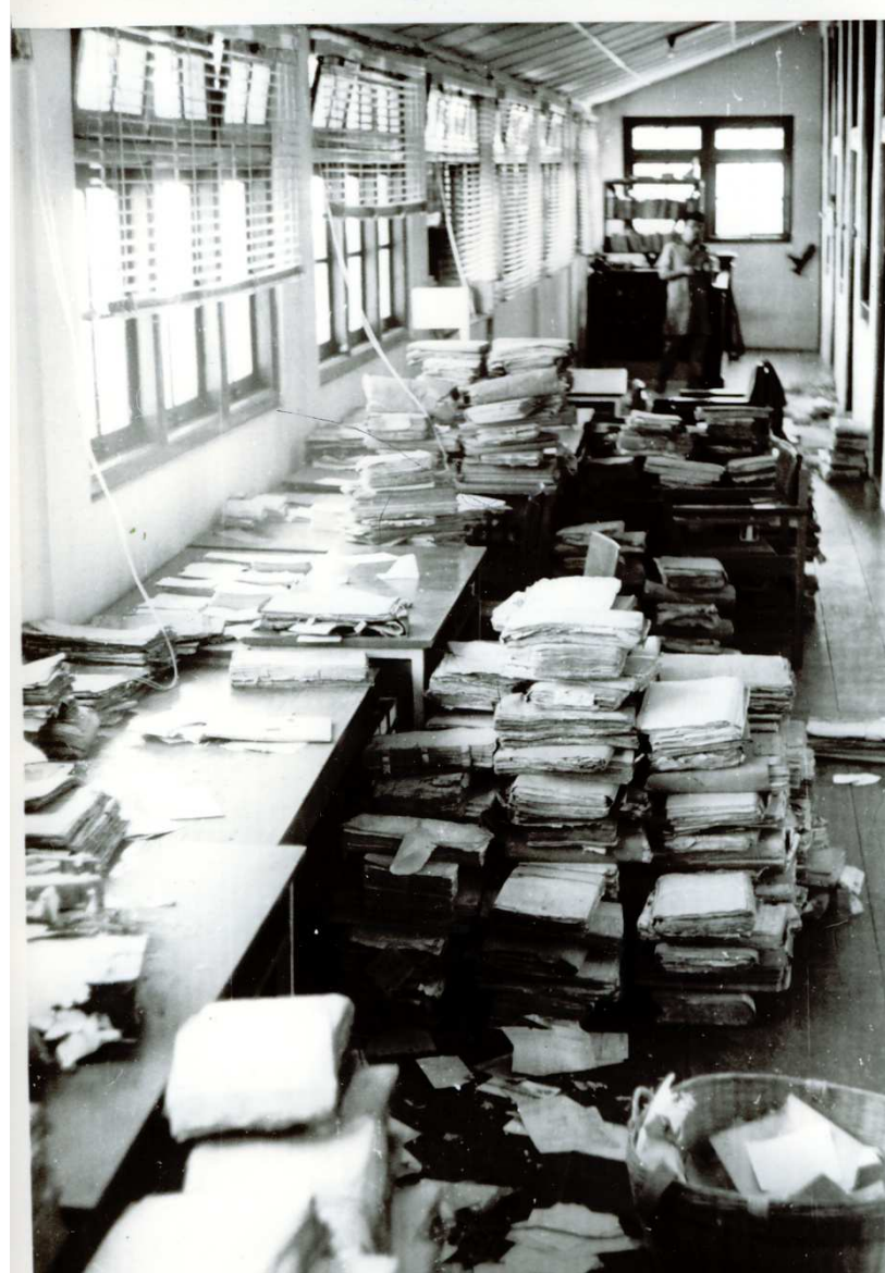
De start van iedere ochtend: uitgepakte en afgestofte bundels die op ons wachten om te worden ontleed, geïnbalanceerd, beschreven en geclassificeerd