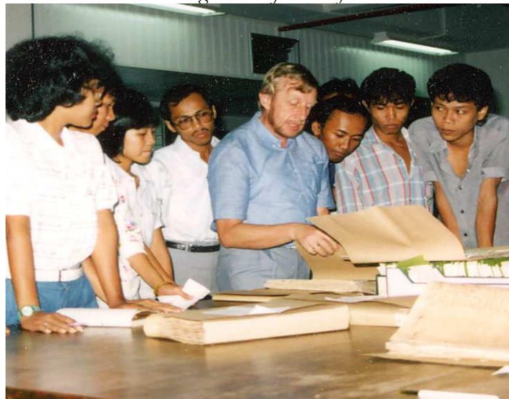
Studenten van de Universitas Indonesia volgen een werkcollege op het Arsip Nasional

Teamleden gehuld in de zojuist (als mijn verjaardagscadeau) binnen-gekomen T-shirts met het logo van het "Algemeen Rijksarchief"