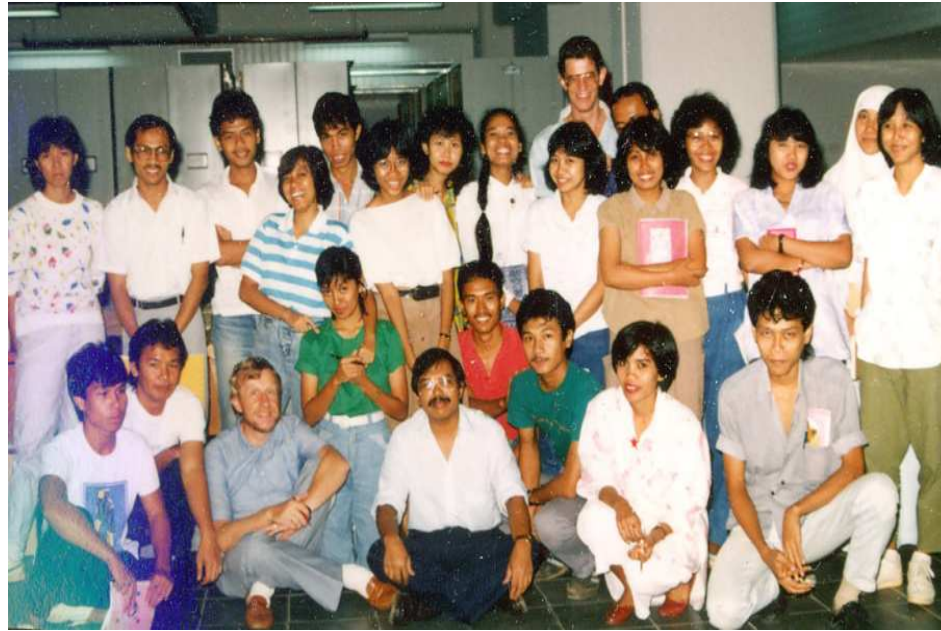
Het team gevormd (en aangevuld!) met de uit alle boeken en gaten van het Arsip Nasional tevoorschijn getoverde medewerkers