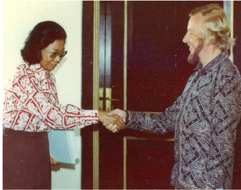
Een tevreden handdruk markeerde het einde van deze grootse onderneming