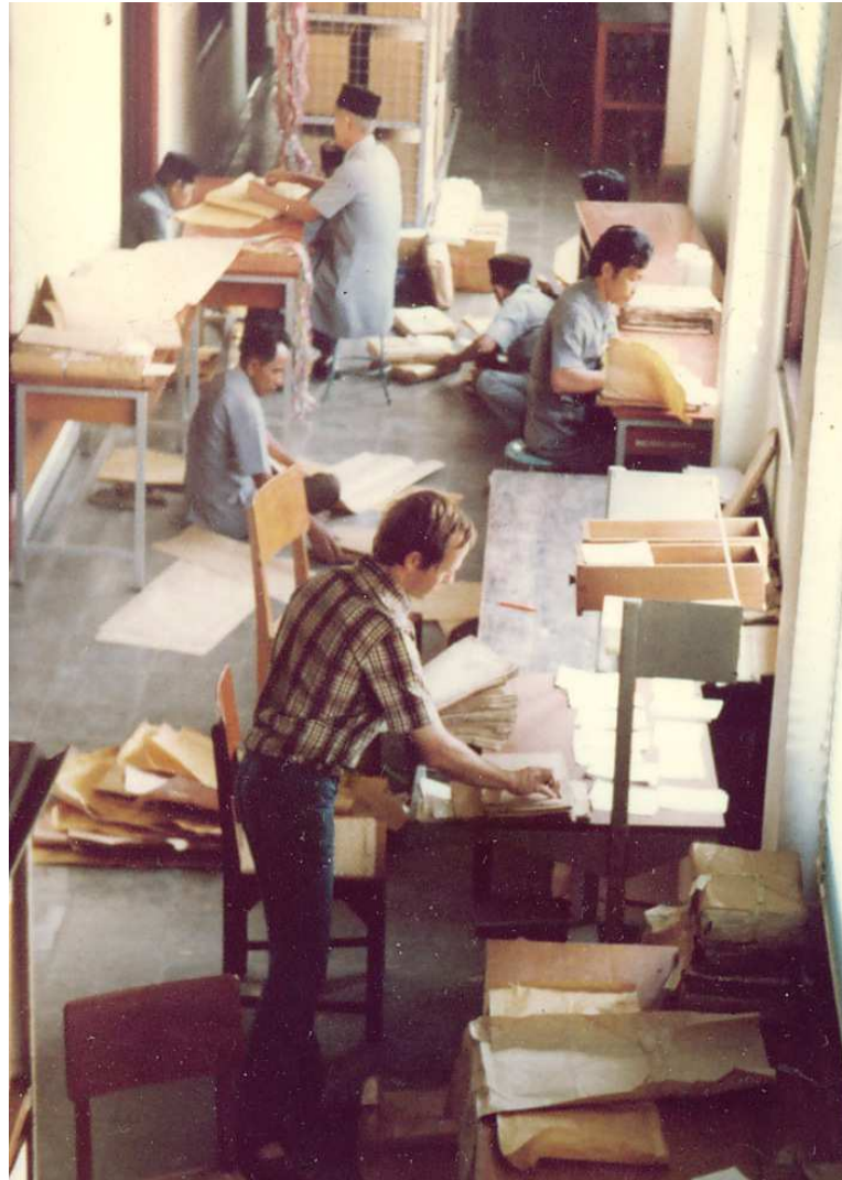
de finale controle, de oplossing van probleem gevallen en het definitief ordenen van de 22.381 fiches