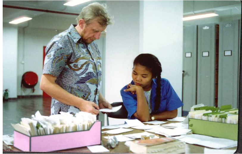
Werkoverleg met een van de teamleden