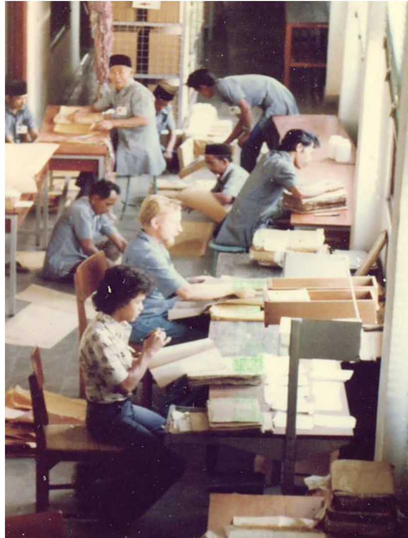
Nu volgt het fijnere werk.....