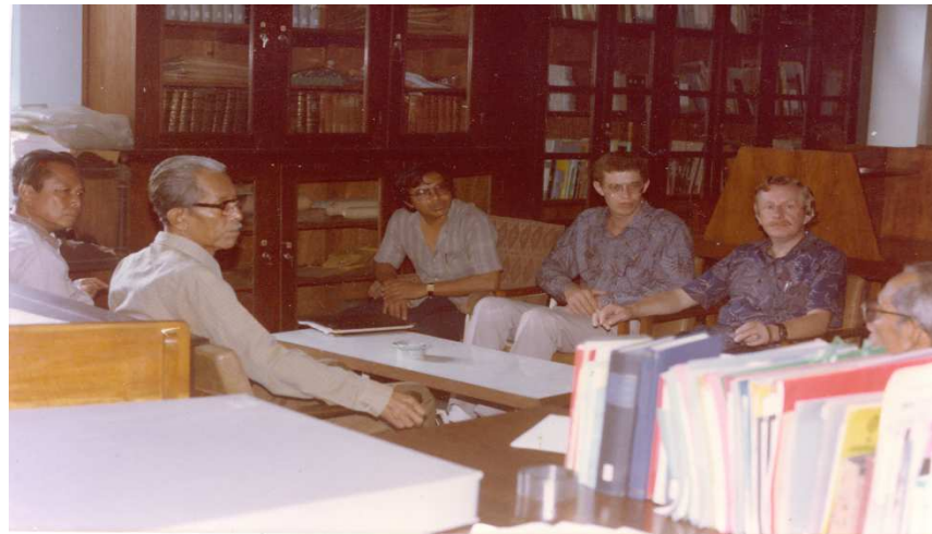
Uitvoerig overleg met de staf van het Mangkunegaranse Hof onder meer over hulp bij de restauratie van de archieven